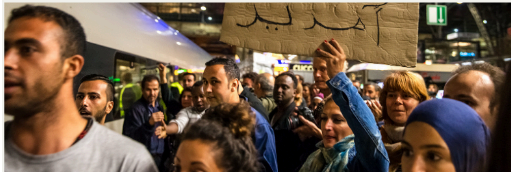
Bild: Fluechtlinge - Train of Hope von Franz Ferdinand Photography lizenziert unter CC BY-NC 2.0