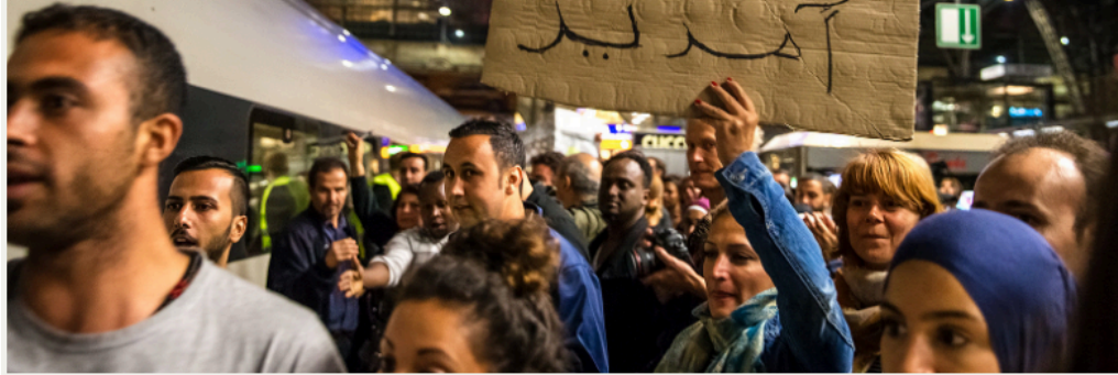
Bild: Fluechtlinge - Train of Hope